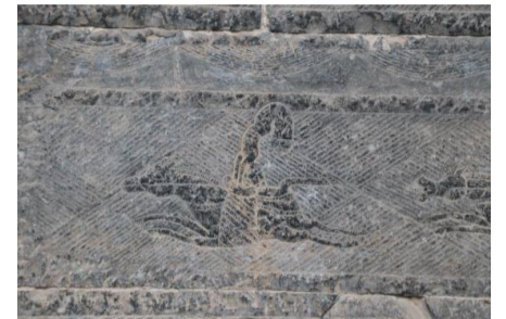
图为马戏图上倒立在马背上的少女

敬畏和崇拜，也反映了古代社会的礼仪制度和宗教信仰，是研究中国古代社会政治、经济、文化等方面的重要实物资料。1961年，少室阙被公布为第一批全国重点文物保护单位。