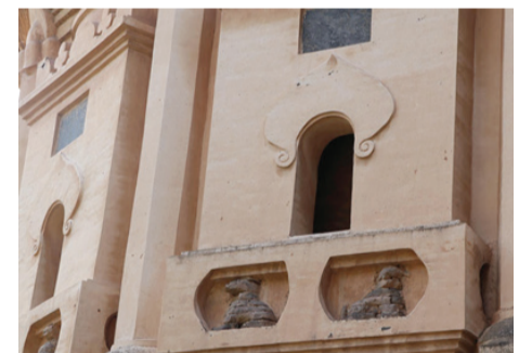
图为嵩岳寺塔局部

作为北魏佛教鼎盛时期的遗物，嵩岳寺塔是中国建筑艺术与西域文明交流互鉴的产物。从建筑布局到整体造型，再到细部雕饰，嵩岳寺塔具有极大的开创性，西安唐代小雁塔、陕西香积寺塔等均脱胎于此塔。因其独树一帜的建筑结构、承前启后的历史地位，嵩岳寺塔被誉为“华夏第一塔”。