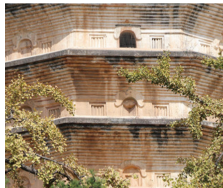
图为嵩岳寺塔局部。

式塔。其塔高约40米，周长33.28米，壁厚2.50米，塔室底层东、西、南、北四面均辟有入口，直接进入塔心内室。各塔层之间均有壶门、棂窗、雕兽等，外形刚健而秀丽。