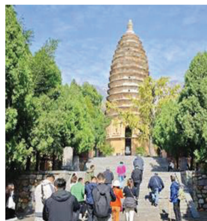
图为海外华文媒体代表探访嵩岳寺塔

中国现存最早的塔、中国唯一的十二边形塔、南北朝唯一现存古塔、世界上最早的筒体结构建筑……10月25日，“行走中国·报道中国海外华文媒体河南行”活动走进古都郑州，探访位于嵩山南麓的“塔王”——嵩岳寺塔。